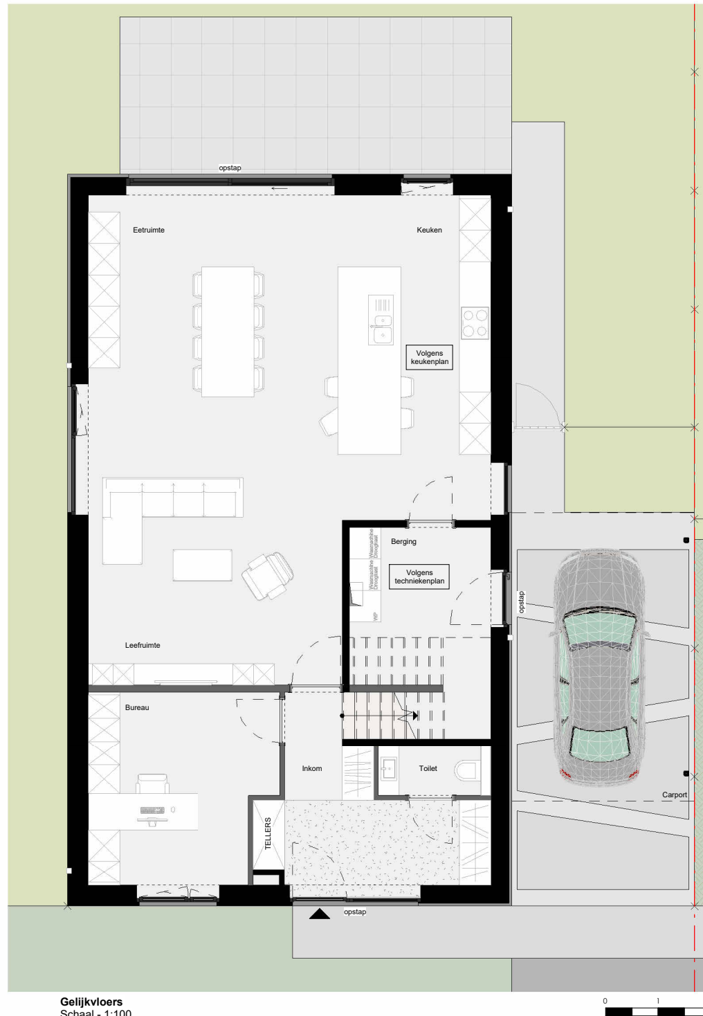
Gelijkvloers Schaal - 1:100