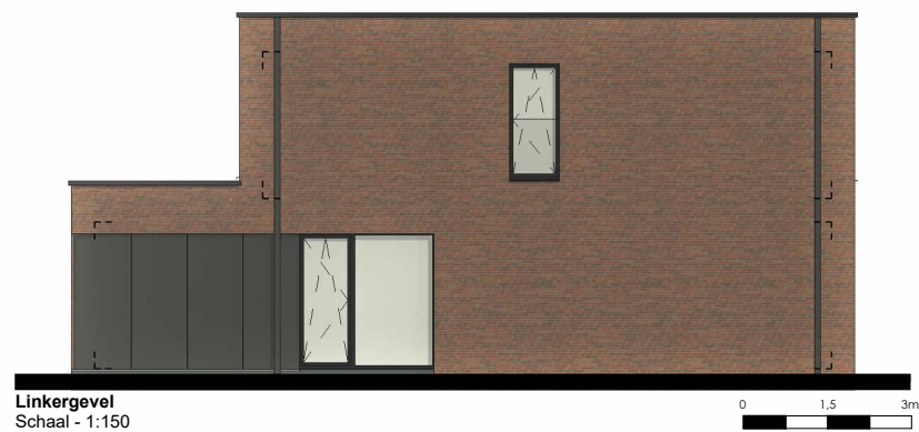
Linkergevel Schaal - 1:150