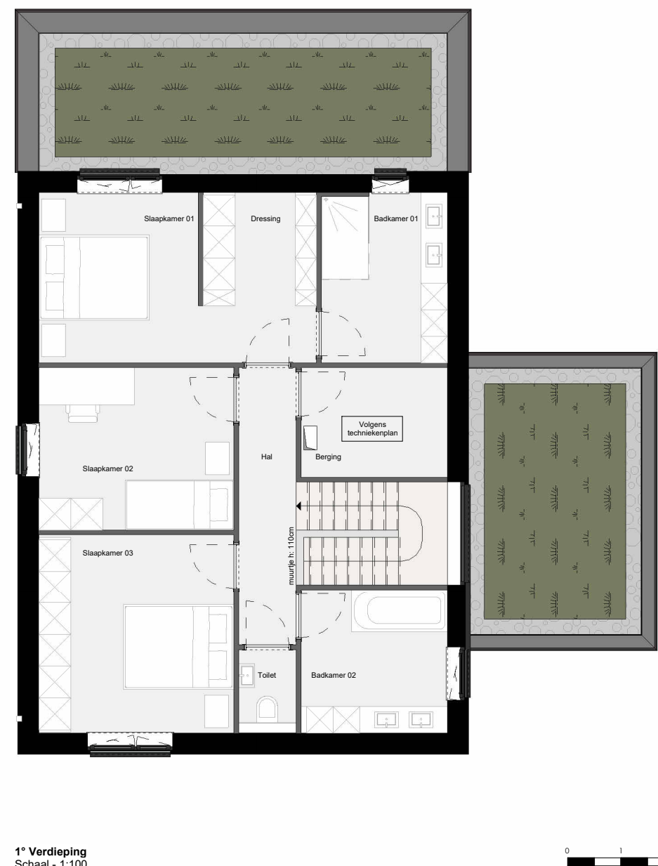
1 e Verdieping Schaal - 1:100