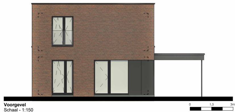
Voorgevel Schaal - 1:150