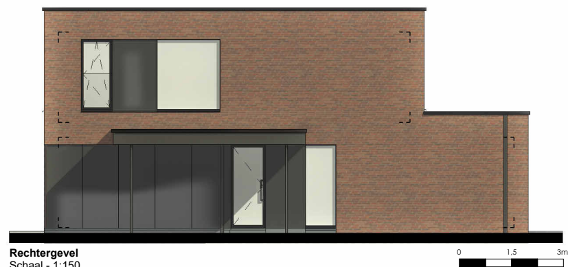
Rechterevel Schaal - 1:150