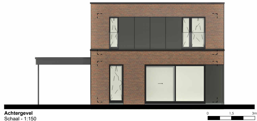
Achtergevel Schaal - 1:150