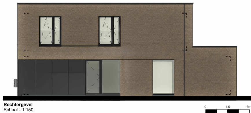
Rechtergevel Schaal - 1:150