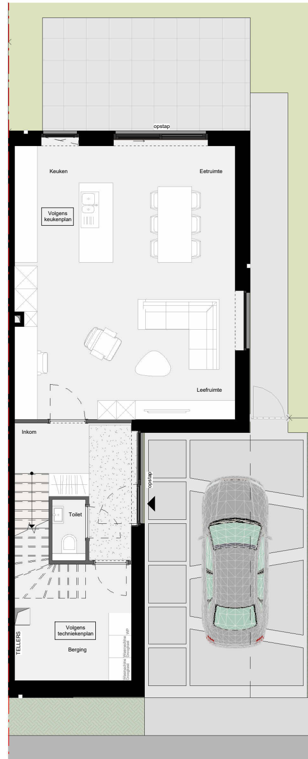
Gelijkvloers Schaal - 1:100