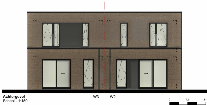
Achtergevel Schaal - 1:150