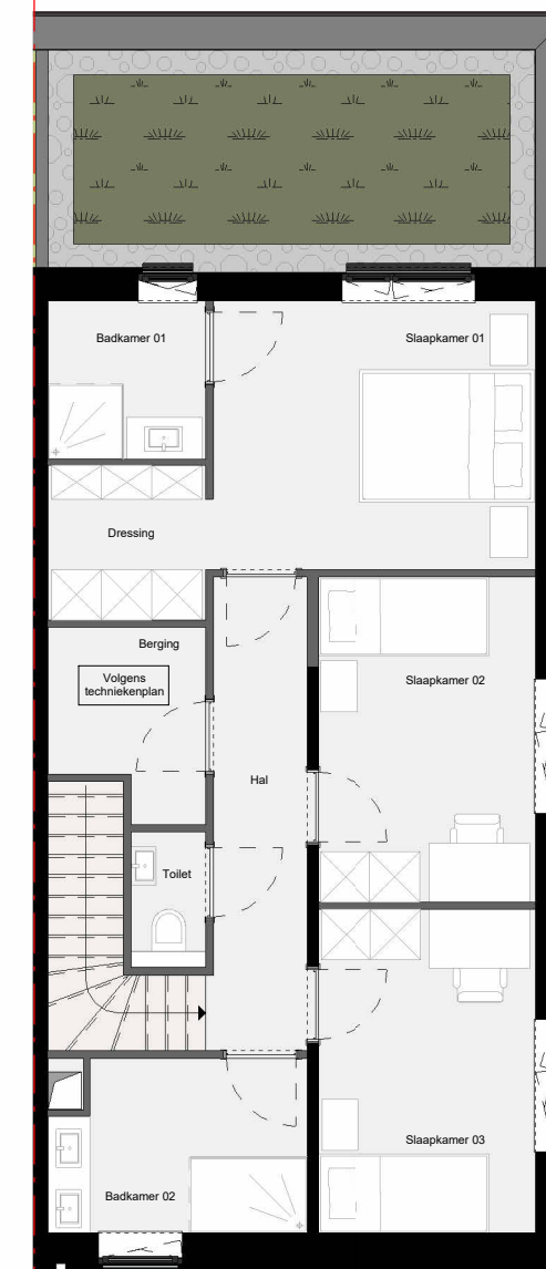
1° Verdieping Schaal - 1:100